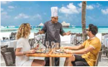
ทานอาหาร