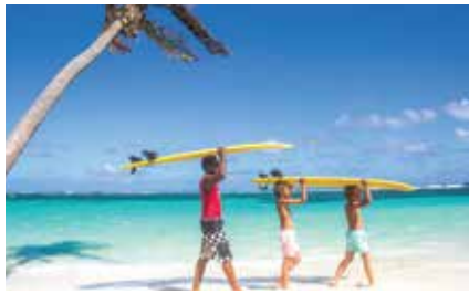
เล่นกระดานโต้คลื่น