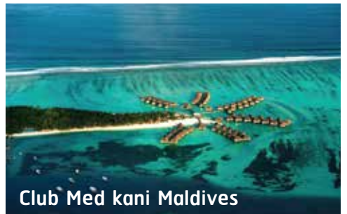
Club Med kani Maldives

จากนั้นให้ท่านอิสระพักผ่อนตามอัธยาศัยกับทัศนียภาพอันสวยงามของมัลดีฟส์