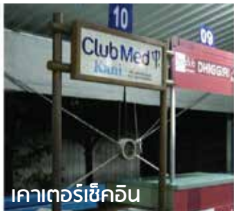
เคาน์เตอร์เช็คอิน

เดินทางถึง สนามบินนานาชาติบราฮิม นาซอร์ เมืองมาเล่ ประเทศมัลดีฟส์ หลังผ่านพิธีการตรวจคนเข้าเมืองและศุลกากรแล้ว ให้นำท่านติดต่อ เคาน์เตอร์ รีสอร์ท CLUB MED ณ สนามบินฯ เจ้าหน้าที่จะนำท่านเดินทางสู่ CLUB MED KANI โดย เรือเร็ว (SPEED BOAT) ใช้เวลาประมาณ 30 นาที