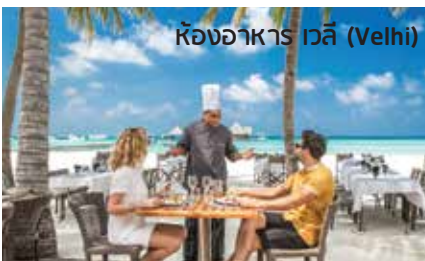
ห้องอาหาร เวลี (Velhi)