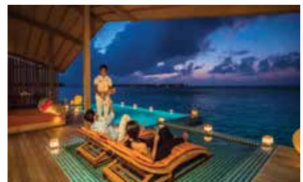
ดินเนอร์สุดโรแมนติก