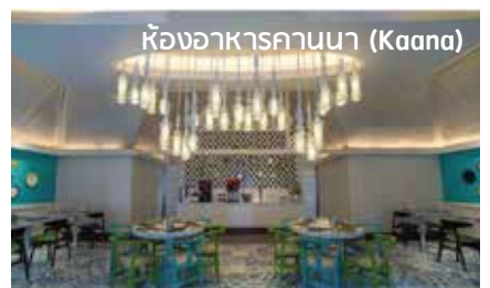
ห้องอาหารคานนา (Kaana)