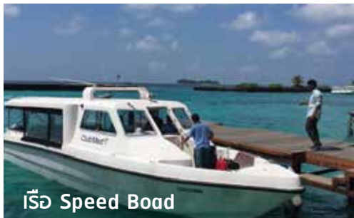
เรือ Speed Boad